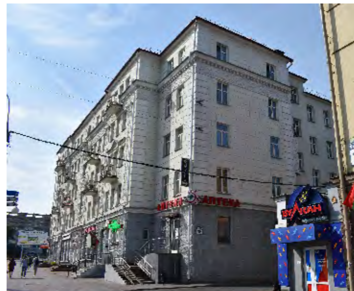
Здание №16 после капремонта. 2018г.