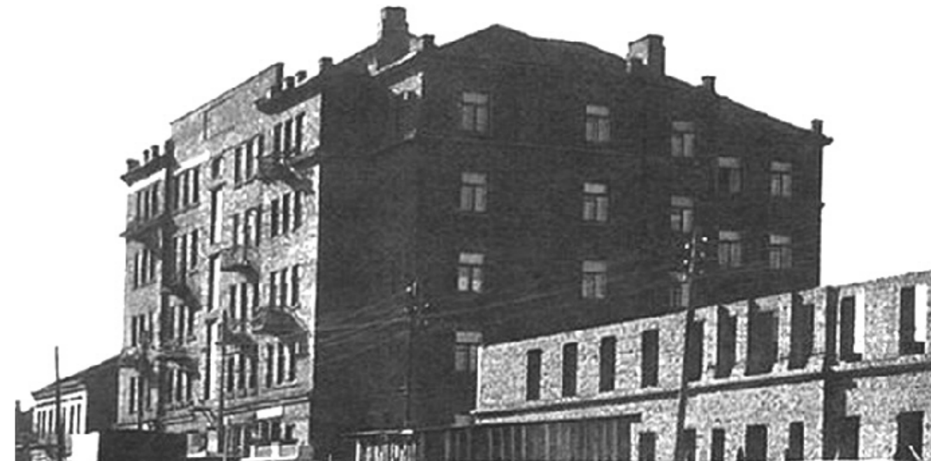
Фото начала 1950-х годов. Здание №16 до перестройки.