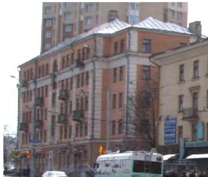
Здание №16 до капремонта. 2015г.?